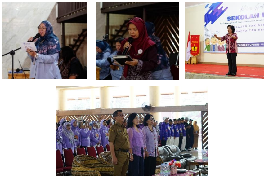
Gambar 1 Pembukaan oleh MC, Kegiatan Doa Bersama dan Menyanyikan lagu Indonesia Raya dan Mars Lansia

Tahap pelaksanaan dimulai pukul 07.30 WIB dengan kegiatan registrasi peserta dan screening awal terhadap kondisi fisik peserta. Kegiatan diawali dengan sambutan hangat dari instruktur yang membuka sesi dengan ucapan salam kepada seluruh peserta oleh MC. Suasana pembelajaran yang kondusif dan inklusif dibangun sejak awal melalui komunikasi yang ramah dan penuh empati. Setelah itu, peserta diajak untuk membacakan doa bersama sebagai bentuk refleksi spiritual dan pembentukan suasana belajar yang tenang. Dilanjutkan dengan menyanyikan lagu Indonesia Raya dan Mars Lansia dipandu oleh dirijen Lansia.