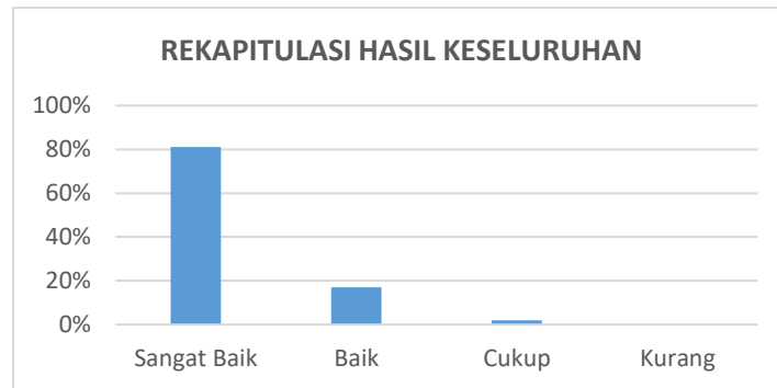
Gambar 7 Rekapitulasi Hasil Keseluruhan Kegiatan Seminar Umum Sekolah Lansia

Berdasarkan hasil evaluasi yang diisi oleh 450 peserta lansia, kegiatan Seminar Umum Sekolah Lansia memperoleh respons yang sangat positif. Mayoritas peserta memberikan penilaian pada kategori “Sangat Baik” dengan rata-rata persentase sebesar 81% . Peserta menilai bahwa materi seminar sangat bermanfaat, mudah dipahami, serta mampu meningkatkan motivasi lansia untuk tetap sehat, aktif, kreatif, dan produktif di era baru. Selain itu, pelayanan panitia, kenyamanan tempat kegiatan, serta penyampaian materi oleh narasumber juga mendapatkan apresiasi yang tinggi dari peserta. Tingginya persentase peserta yang bersedia mengikuti kegiatan sekolah lansia berikutnya menunjukkan bahwa program ini memberikan dampak positif dan diharapkan dapat terus dilaksanakan secara berkelanjutan sebagai bentuk pemberdayaan lansia melalui kolaborasi antara Universitas Krisnadwipayana dan Pemerintah Daerah (Dinas DP2KB, Kecamatan, dan kelurahan), serta tenaga kesehatan.