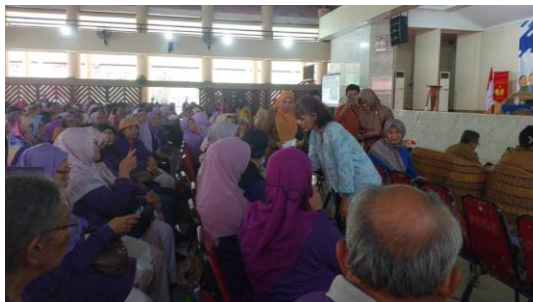
Gambar 5 Peserta mengajukan pertanyaan dan berdiskusi dengan antusiasme tinggi Tahap Penutup

Selama pelaksanaan kegiatan, peserta menunjukkan antusiasme tinggi dalam mengikuti seluruh rangkaian acara. Peserta diberi kesempatan untuk menyampaikan pertanyaan, berbagi pengalaman pribadi, atau memberikan tanggapan terhadap materi yang telah disampaikan. Sesi pemaparan materi dan diskusi berlangsung interaktif, dengan beberapa peserta menyampaikan pengalaman pribadi.