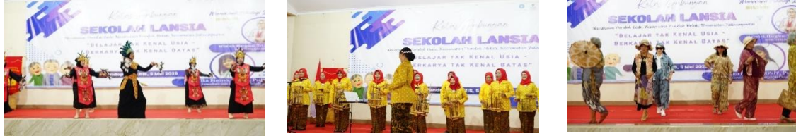
Gambar 2 Penampilan Tari Lenggang, Angklung dan Fashion Show Lansia

musik, dilanjutkan dengan fashion show Kun dengan hasil ecoprinting sebagai karya desain yang kreatif dan inovatif.