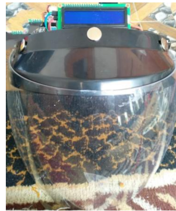
Gambar 2 Hasil Face Shield